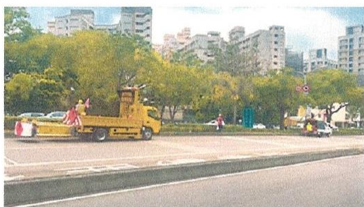
台灣大道鄰近玉門路往市區之下坡路段進行安全島垃圾撿拾作業

台中市政府環保局開國內環保機關首例，新購一台緩撞工程車，以移動式隨人跟車的防護模式，自今年5月起正式加入環境清潔服務行列！環保局指出，為保障清潔隊員服勤安全，針對台中市重點道路進行中央分隔島垃圾清理作業時，特別安排清潔車輛隨行前後距離，強化安全緩衝戒護範圍，讓清潔隊員在道路進行高風險作業時，藉由車輛機具防撞及明顯警示標語的保護措施，提升道路行車安全與環境清潔服務量能。