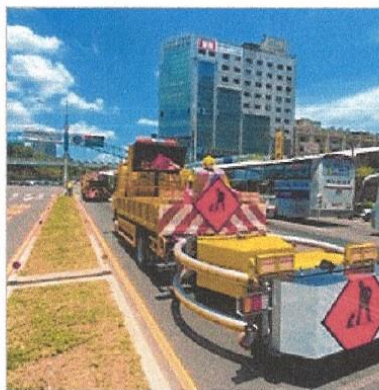
台灣大道鄰近玉門路往市區的下坡路段進行安全島垃圾撿拾作業