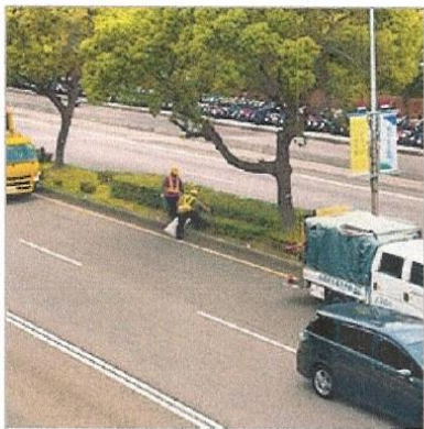
台灣大道鄰近玉門路往市區之下坡路段進行安全島垃圾撿拾作業情形